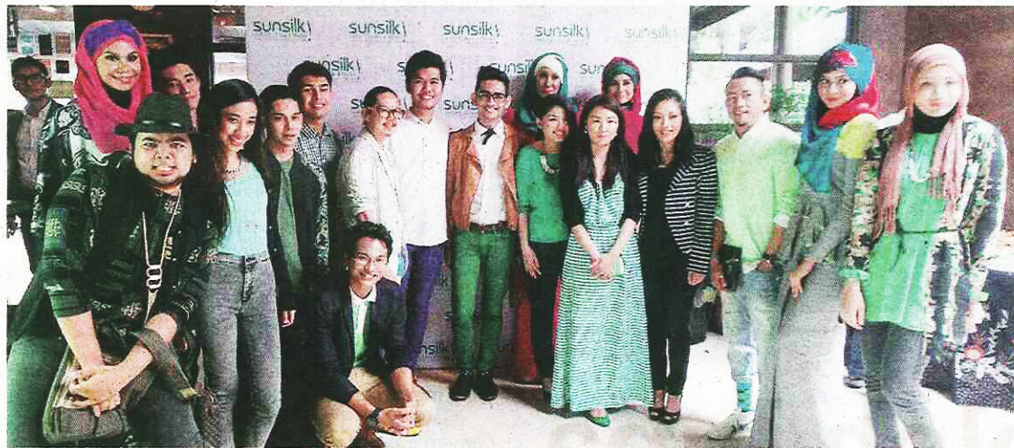
10 pereka muda dan model berhijab berentap dalam pertandingan Hijabku Gayaku dari Sunsilk Lively Clean & Fresh .