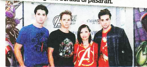
Koleksi ini dijangka mampu beri kepuasan kepada mereka yang menggemari animasi komik Marvel.