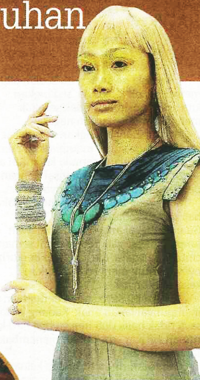
Model memperagakan gelang dan rantai dari koleksi Oro Italia.

halus pembuatannya dan dihasilkan melalui kerja tangan yang begitu teliti oleh tukang berpengalaman. Koleksi ini boleh didapati pada rantai, gelang tangan, dan dipasarkan secara eksklusif oleh Habib di Malaysia. "Barang kemas adalah aksesori yang sesuai menceriakan golongan muda dan berusia, koleksi ini juga sesuai digayakan ketika mengenakan pakaian tradisional mahupun gaun malam," katanya.