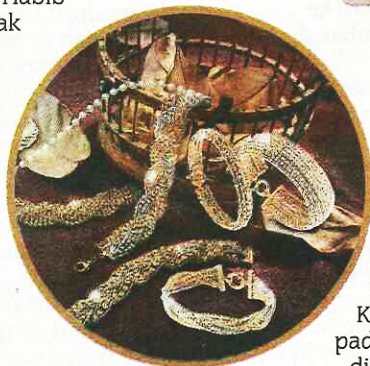
Kehalusan pembuatan terserlah pada rekaan rantai dan gelang tangan.