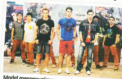
Model menggayakan semua koleksi Avengers Assemble yang kini berada di pasaran.